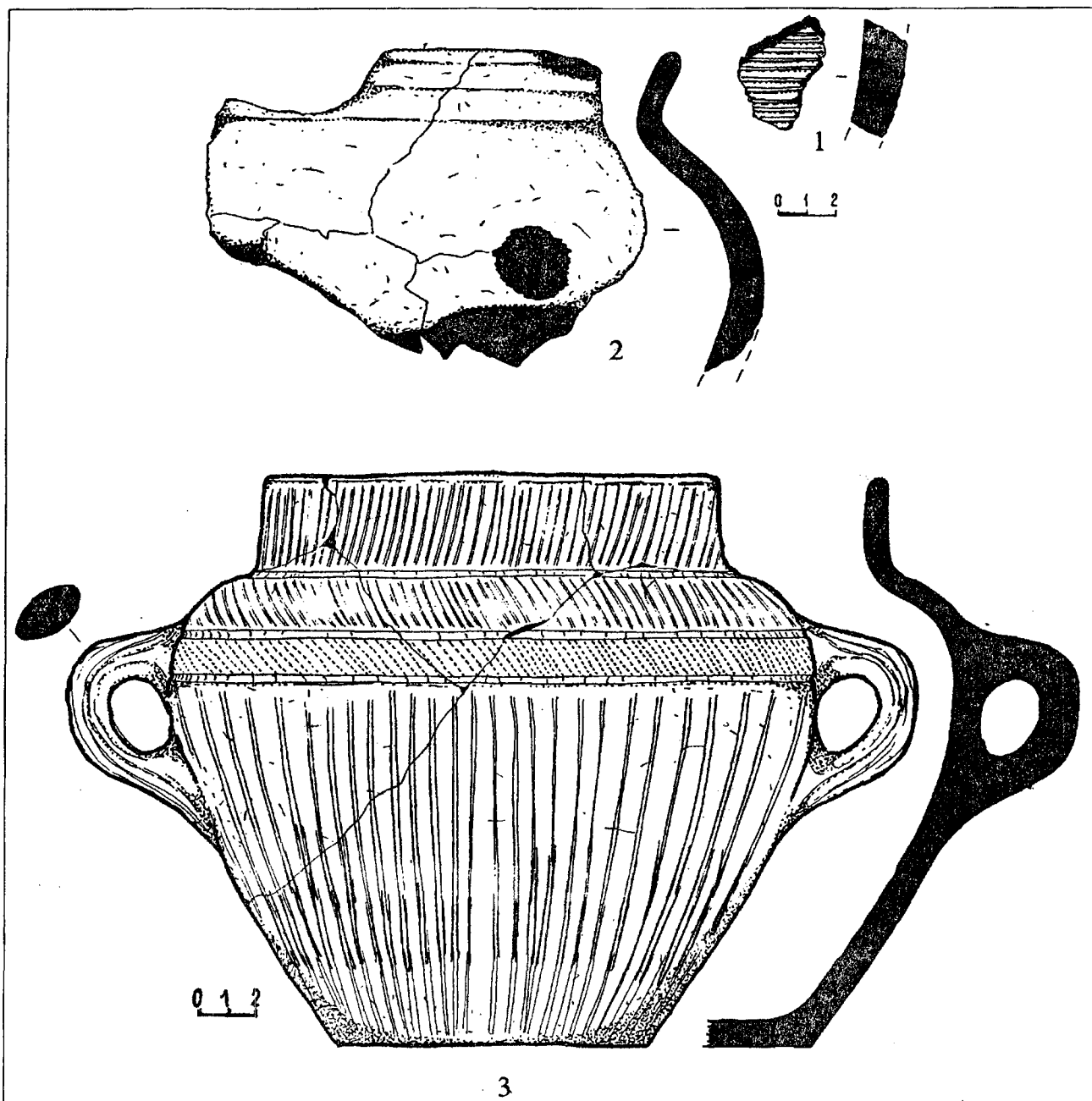
Рис.2. Верхньо-Салтівський IV катакомбний могильник. Катакомба №58. Кераміка.

подібний тулуб та невелике дно. Висота горщика дорівнює 28,8 см, діаметри: вінець — 22,4 см, максимальний тулуба — 31,6 см, дна — 15,2 см. Посудина має дві бокові петлеподібні ручки, котрі прикріплені в місці переходу плічок у конусоподібний тулуб. Колір поверхні горщика коливається від світло-коричневого до темно-коричневого. Горщик прикрашено вертикальними лискованими смугами на вінці, плічках, тулубі, а також трьома горизонтальними канелюрами. Зона між двома нижніми канелюрами, що знаходять-