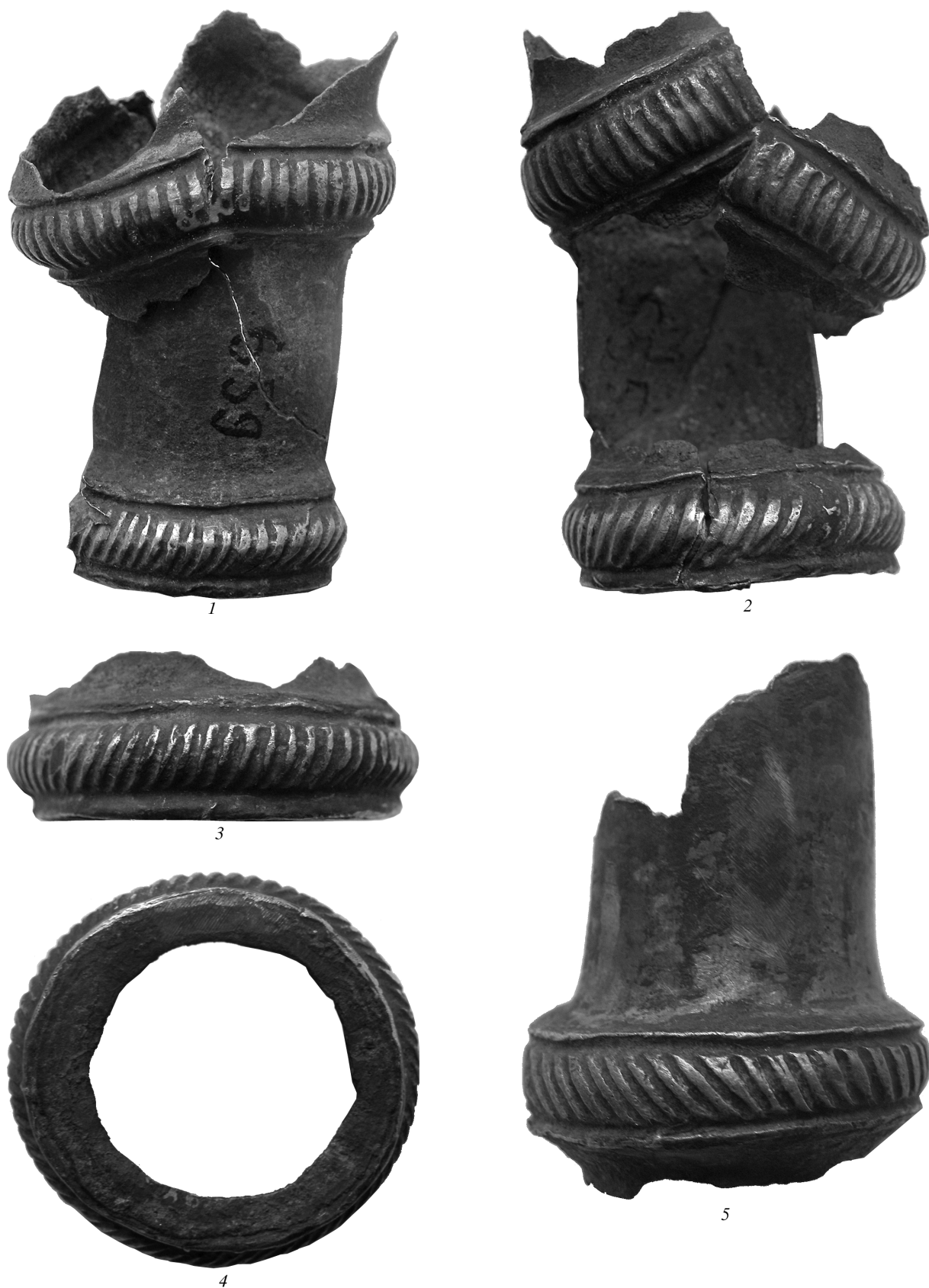
Рис. 2. Полые цилиндрические трубочки. 1, 2 (оборотная сторона) – ЛВС-28, ЛВС-30; 3, 4 (вид снизу) – фрагмент (ЛВС-27); 5 – фрагмент (ЛВС-29). (1, 2 – высота 5,7 см; 2 – диам. нижний 3,4; 3, 4 – диам. 3,5/3,6; 5 – высота 4,2 см, диам. – 3,3).