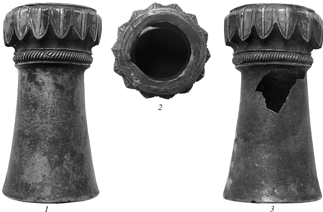
Рис. 1. Наконечник ножки табурета. 1, 3 – общий вид; 2 – вид сверху (диам. нижний – 5,8 см, диам. верхний – 5,7 и 5,9; высота – 11; размеры здесь и далее – максимальные).

Внешний вид наконечника ножки притронного табурета хорошо известен по многочисленным публикациям – он представлен полым усеченным серебряным конусом с едва вогнутыми стенками (ЛБС-265). В верхней части находится орнаментальный пояс из 14 рифленых лепестков, обращенных острым концом вниз. Под лепестками размещается еще один пояс, состоящий из трех валиков: узких гладких по краям и широкого, орнаментированного косым рифлением, посередине. Валики и лепестки обтянуты тонкой золотой пластиной (рис. 1, 1, 2).