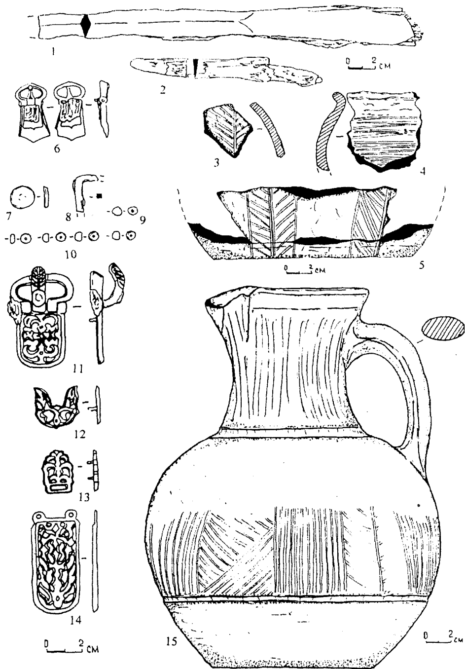
Рис. 2. Инвентарь погребения № 491:

1 — наконечник копья; 2 — нож; 3–5 — фрагменты салтовских сосудов из заполнения могильной ямы; 6 — пряжка от ремней оголовья; 7 — фалар; 8 — фрагмент пряжки; 9, 10 — бусы; 11 — поясная пряжка; 12, 13 — поясные бляшки; 14 — наконечник пояса; 15 — кувшин; 1, 2, 8 — железо; 3–5, 15 — глина; 5, 7, 11, 14 — бронза; 9, 10 — стекло; 12, 13 — серебро