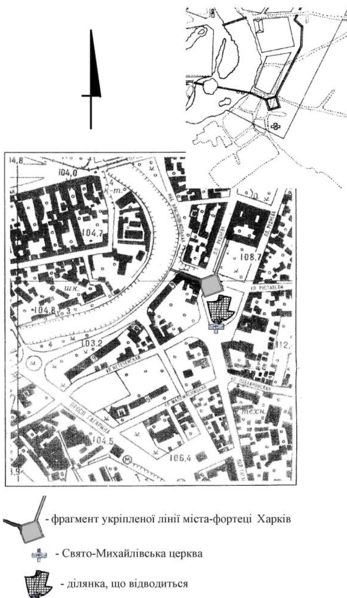
Рис. 1. Нанесення фрагменту укріпленої лінії міста-фортеці Харків на сучасну топографічну основу

ЧУГУЇВСЬКИЙ Р-Н. Багатошарове поселення (неоліт — ямково-гребінцева культура, доба бронзи, раннє середньовіччя — пеньківська культура) «Кочеток—Водокачка» (виявлене І.В. Голубевою 2011 р.), Кочетоцька сільрада.