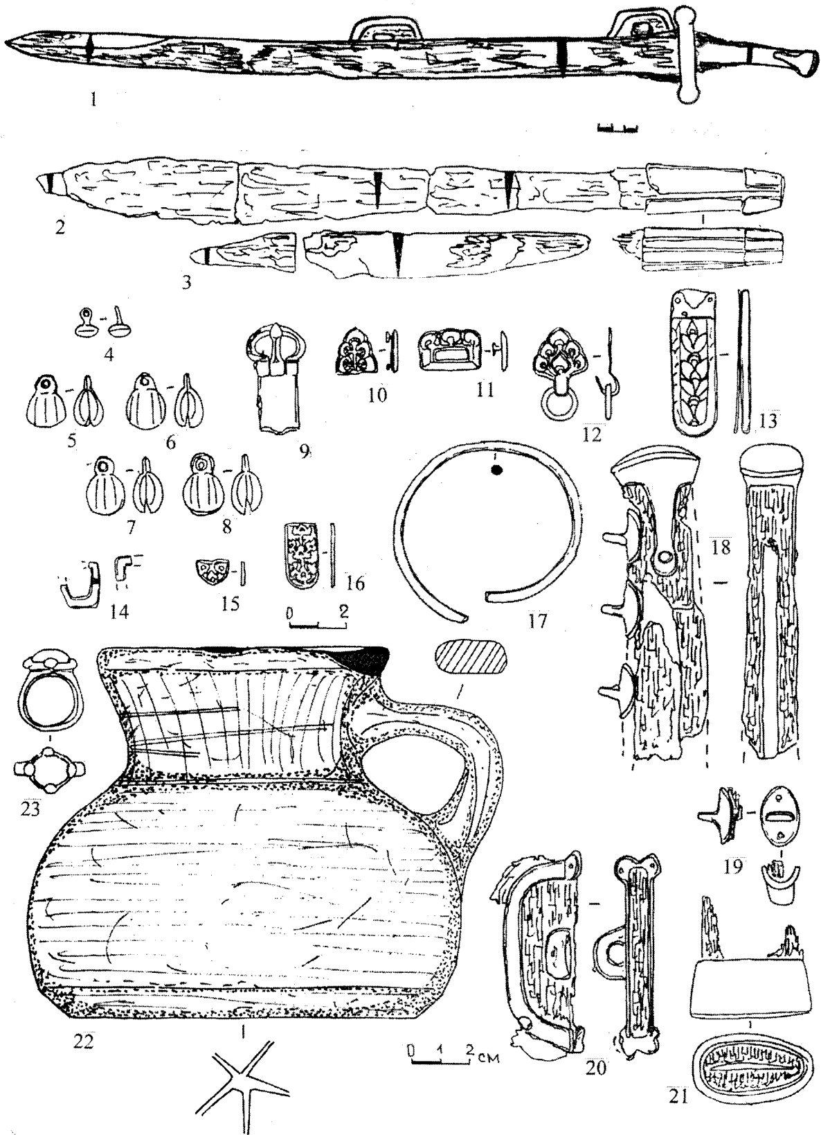
Рис. 2. Инвентарь погребения № 1. 1 — сабля, 2, 3 — ножи, 4 — пуговица, 5—8 бубенчики, 9 — поясная пряжка, 10—12 — поясные бляшки, 13 — наконечник пояса, 14 — фрагменты пряжки от обувного ремешка, 15, 16 — бляшка и наконечник от обувных ремешков, 17 — браслет, 18 — рукоятка сабли, 19 — захват для пальцев, 20 — портупейная скоба, 21 — наконечник ножен сабли, 22 — кружка, 23 — перстень.