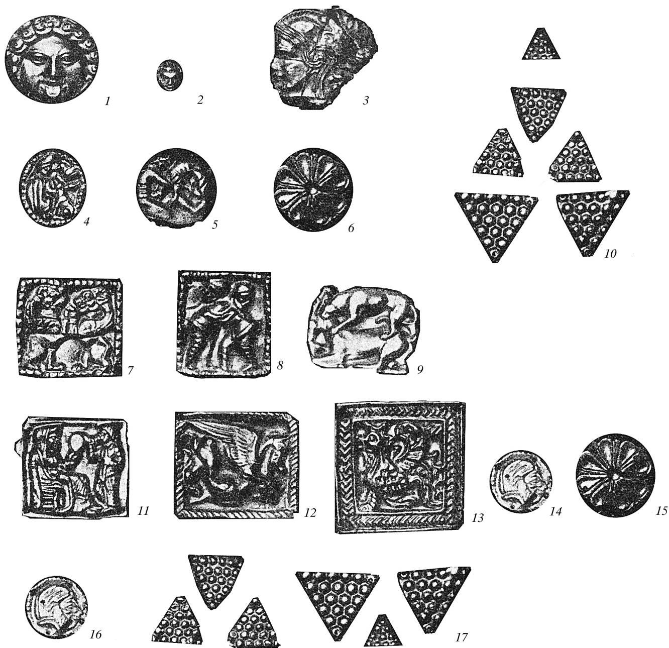
Рис. 3. Распределение золотых бляшек по комплексам курганов Чмырева Могила (1–10) и Верхний Рогачик: центральная (11–15) и боковая (16, 17) могилы. Для позиций 6 и 15, 10 и 17, 14 и 16 Н.И. Веселовским использованы фотографии одних и тех же бляшек (ОАК 1913–1915. Рис. 221).

бляшки из присутствующих на опубликованной фотографии (Рис. 221). Содержатся упоминания находок следующих аппликаций: