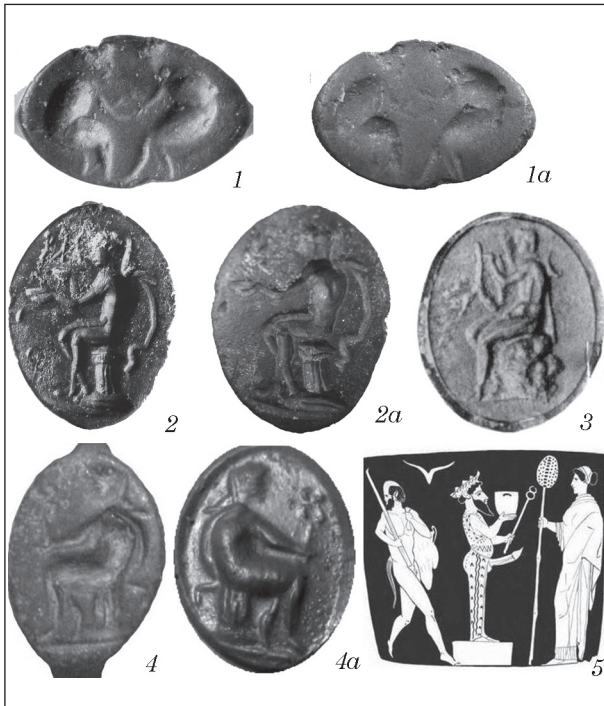
Рис. 1. Щитки бронзовых перстней (1—4): 1, 2 — Бельское городище [Шрамко, 1987, рис. 74]; 3 — Ольвия [Античная ..., 1973, кат. 113]; 4 — Крым (фото щитка, а — оттиск) [http://perstni.com]; 5 — изображение Гермеса с кадуцеем и сосудом на кратере из Сиракуз [Ходза, 2008, ил. 4]

Строгая периодичность праздника усиливала его значения в жизни местного населения, так как он мог служить основой для календарных расчетов. В таком важном празднестве должен был принимать участие и гелонский царь, возможно, в качестве верховного жреца-эпонима. В таком случае надпись на перстне могла передавать его имя. Известно, что Дионис нередко изображался с головой быка или бычьими рогами, что соответствует рисунку на втором перстне» [Шрамко, 1987, с. 161, 162; рис. 74].