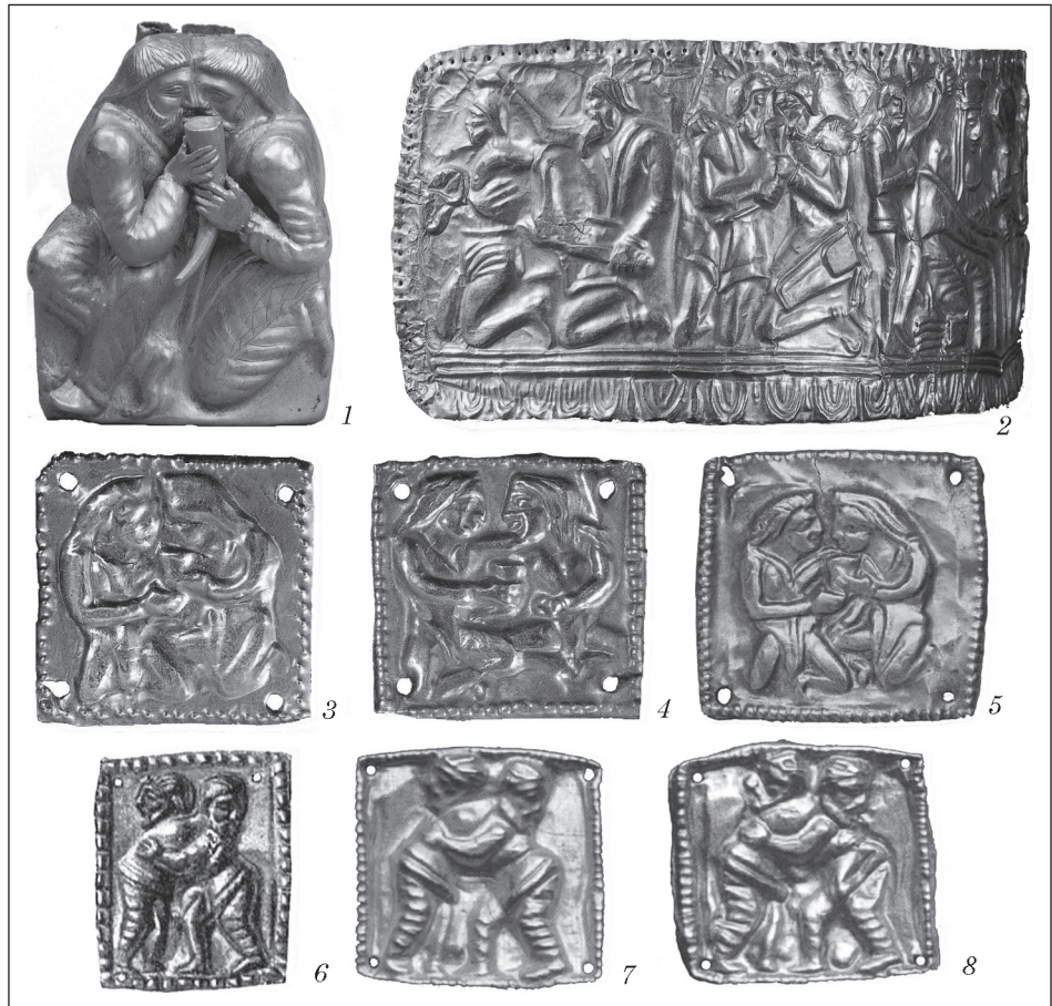
Рис. 2. Золотые украшения с изображением сцен побратимства (1—5) и борьбы (6—8): 1 — Куль-Оба [Scythian ..., 1986, pl. 196]; 2 — Сахановка [Золото ..., 1991, кат. 99]; 3, 4 — Бердянский курган [Золото ..., 1991, кат. 100g]; 5 — Солоха [Алексеев, 2012, с. 161]; 6 — Чмырева Могила [Браун, 1906, рис. 37]; 7, 8 — курган № 8 группы «Пять братьев» Елизаветовского курганного могильника [L'Or ..., 2001, cat. 85]

очень отчетливое впечатление обнаженности мужчин 2 (рис. 1, 1, 1а).