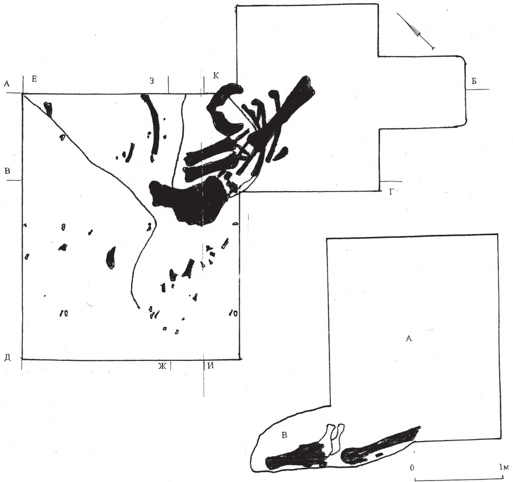
Рис. 2. План і розріз ями, де були знайдені кістки мамонту А – яма погребу; Б – вхід з боку будинку; В – підбій