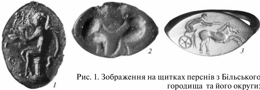
Рис. 1. Зображення на щитках перснів з Більського городища та його округи: 1, 2 – Східне укріплення; 3 – курган № 2/2001 Перещепинського могильника.

Подібне тлумачення цілком виважене і не викликає заперечень. Разом із тим хотілося б звернути увагу на два цікаві моменти. По-перше, з урахуванням вірогідної атрибуції зображення двох протипоставлених чоловічих фігур на щитку одного з бронзових перснів зі Східного Більського не як сцени скріплення клятви чи угоди між вождями будинів та гелонів, а як зображення двох атлетів-борців на початку поединку, впадає в очі домінування агоністичної тематики серед сюжетів більських перснів. Хоча, зважаючи на малорепрезентативність вибірки, навіть попередні висновки з цього приводу будуть передчасними.