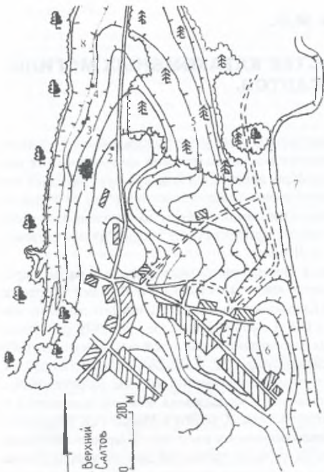
Рис.1 Схема расположения раскопов на Верхне-Салтовском IV катакомбном могильнике. 1 – раскопы 1996-2006 гг.; 2 – катакомба №55; 3 – катакомба №68, 69; 4 – катакомба в обрыве нетечинского яра, раскопки 2006 г.; 5 – расположение Верхне-Салтовского III катакомбного могильника; 6 – Верхне-Салтовское городище; 7 – Печенежское водохранилище; 8 – Нетечинский яр