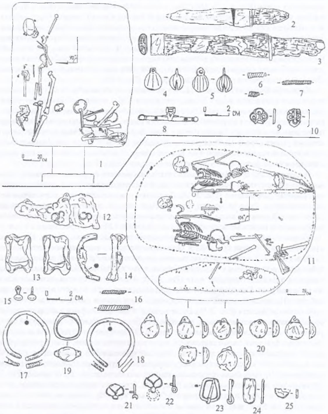
Рис. 3 Катакомбы № 68, 69. 1 – план погребальной камеры катакомбы № 68, 2-10 – инвентарь из катакомбы № 68; 11 – погребальная камера катакомбы № 69; 12-25 – инвентарь из катакомбы № 69.