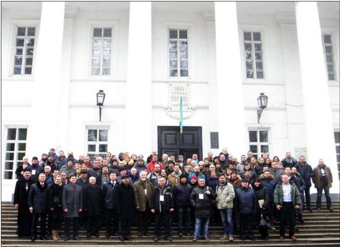
Учасники І Всеукраїнського археологічного з'їзду