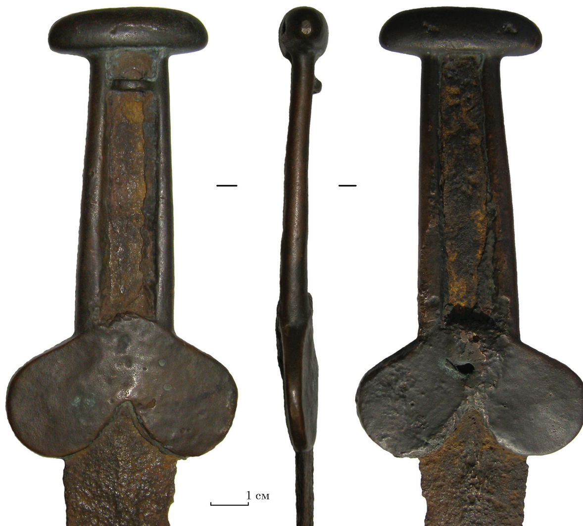
Рис. 3. Рукоять біметалевого меча з колекції ХІМ