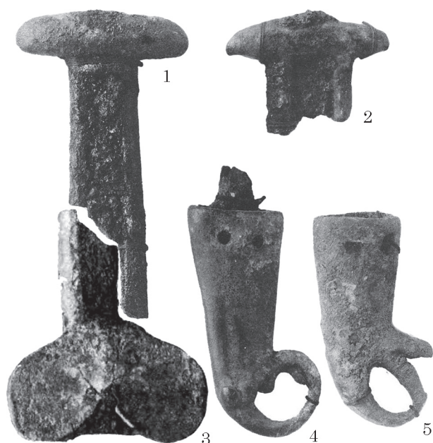
Рис. 4. Фрагменти рукоятей біметалевих мечів та бутеролі з могильників Кумбулта та Фаскау на Північному Кавказі, без масштабу (1, 2, 4, 5 — Уварова 1900; 3 — Крупнов 1960)

спільну проміжну ланку походження — в один і той же час перебували в одному місці. Однак цікаво проаналізувати вірогідність спільного первісного джерела для обох предметів, документована інформація про походження яких втрачена, адже вони належать до одного культурного і хронологічного контексту та пов'язані між собою функціонально.