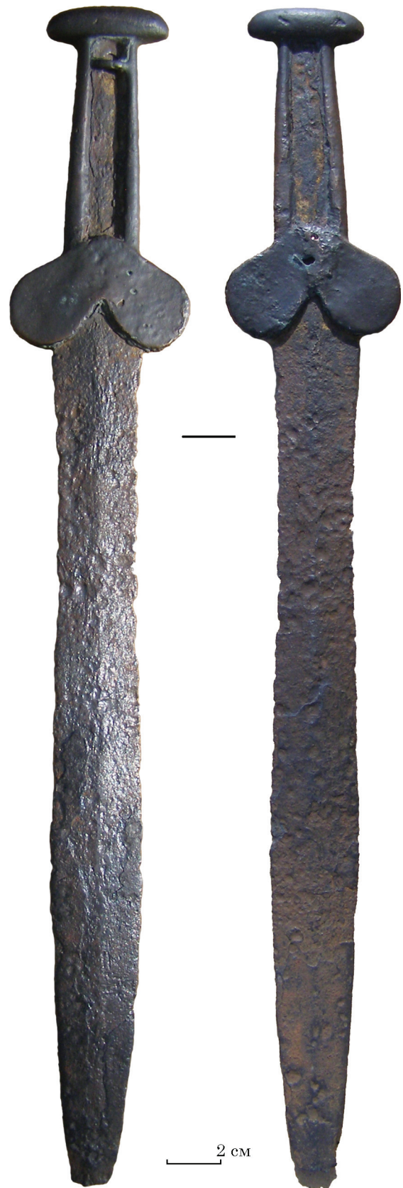
Рис. 2. Біметалевий меч з колекції ХІМ

Незалежно від того, яке з двох припущень ближче до істини, безсумнівним є зв'язок предметів «Харківського скарбу» з археологічною виставкою 1942—43 рр. у Харкові. У цьому випадку є сенс звернути увагу на ще один «безпаспортний» предмет з археологічної колекції ХІМ. Мова йде про біметалевий меч з залізним клинком та бронзовим руків'ям (рис. 2; 3). Меч достеменно було знайдено І. Ф. Левицьким при розкопках згарища археологічної виставки