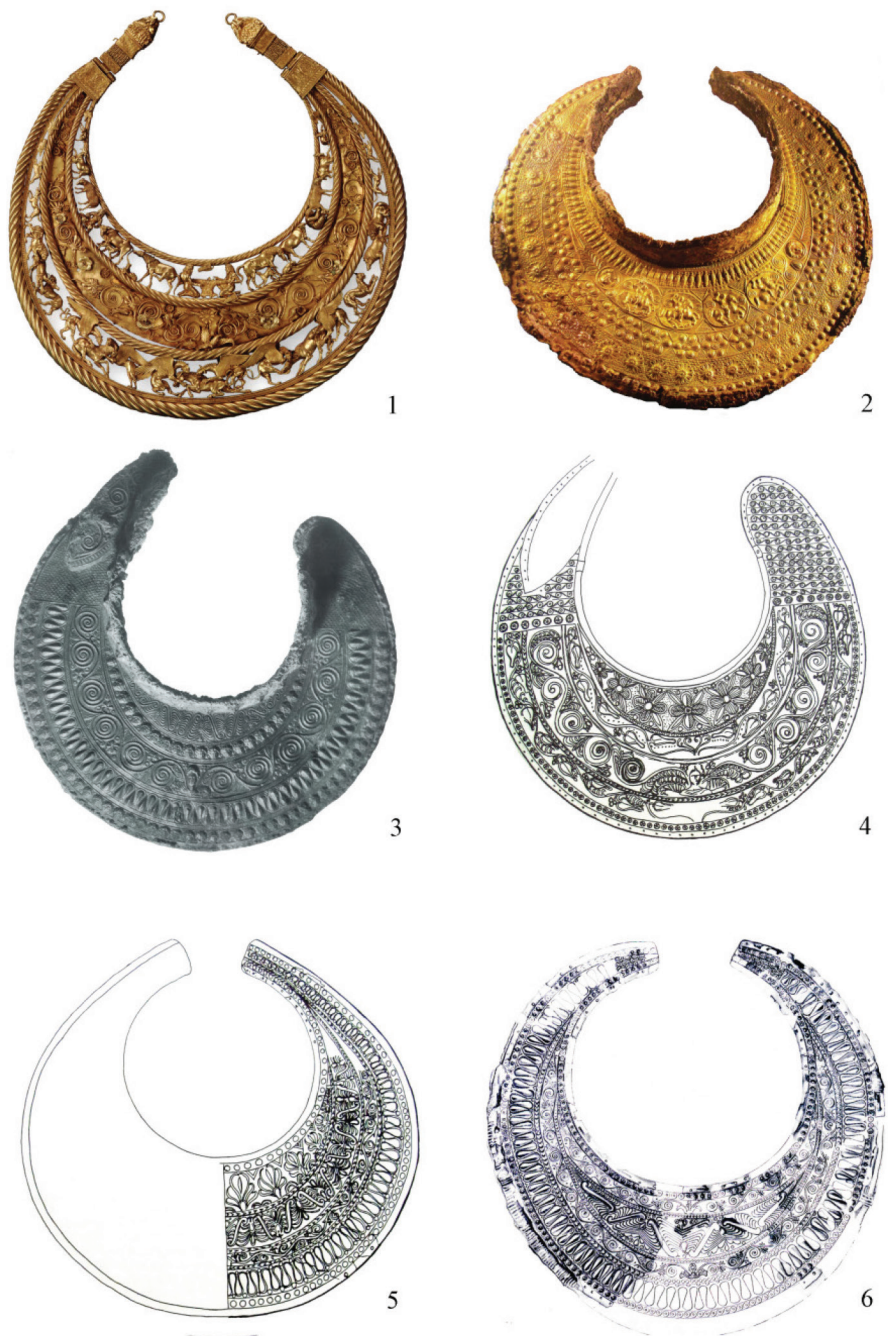
Рис. 2. Пекторали/нагрудники: 1 – Толстая Могила (Dally 2008, 295); 2 – Вергина (Andronicos 1984, 188); 3 – Мезек; 4 – Вырбица (Venedikov et al. 1973, 230); 5 – Катерини (Archibald 1985, 169); 6 – Пидна ((Faklaris 1991, 3).