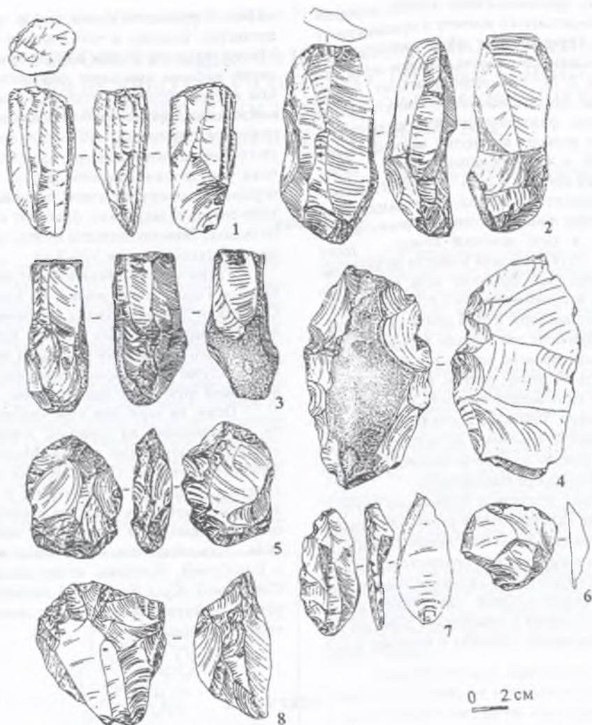
Рис. 3. Крем'яні знаряддя: 1-6 – Суха Кам'янка 3; 7-8 – Синичине 2.

роною, що призначався для виготовлення віджимних платівок та мікроплатівок (рис. 2, 7); фрагментований віджимний призматичний нуклеус з округлим перетином (рис. 2, 6); фрагмент призматичного нуклеусу (рис. 2, 8); заготовка призматичного нуклеусу; заготовка олівцеподібного призматичного нуклеусу донецького типу, має одну пласку сторону та дві реберчасті поверхні, що сходяться.