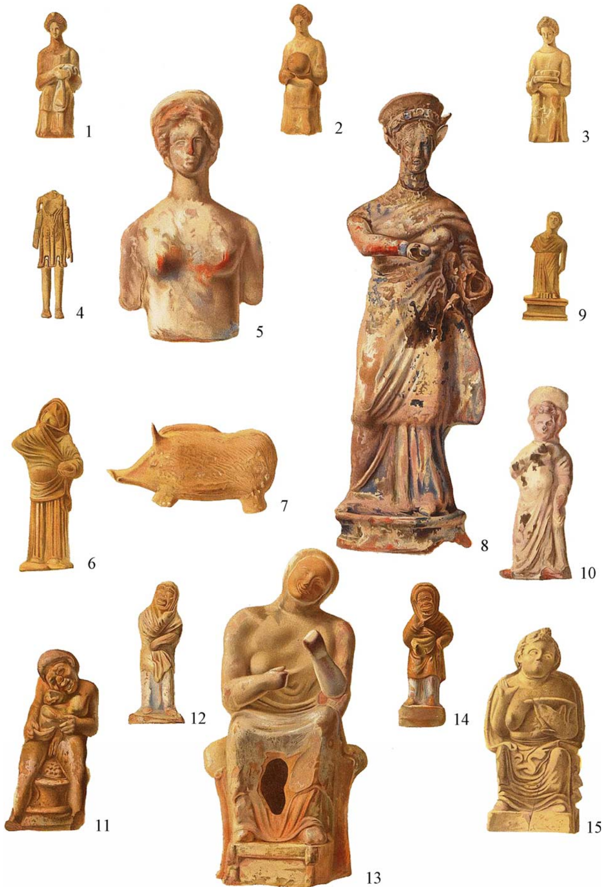
Рис. 11. Терракотні статуетки зі склепу № 4 Великої Близниці (1-15) [ОАК за 1869 год, 1871, табл. III] Fig. 11. Terracotta figurines from tomb № 4 the Velyka Blyznytsia