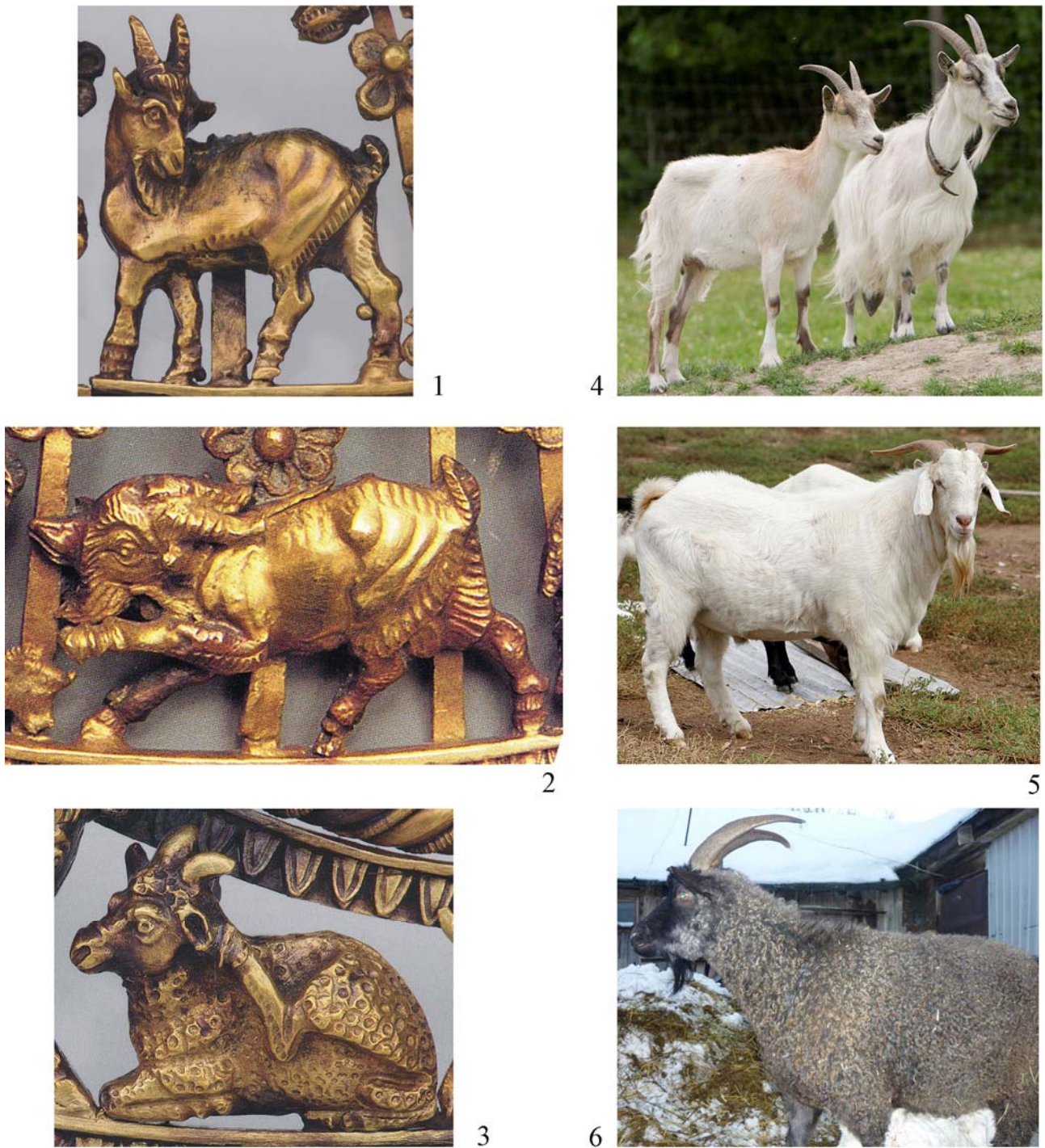
Рис. 9. Відповідність порід кіз на пекторалі з Великої Близниці природним прототипам: 1, 4 – тварини з рогами типу безоарового козла; 2, 5 – козли з рогами типу «пріска»; 3, 6 – козли сучасної придонської породи [Калашник 2014, с. 190, 191; Piotrovsky and etc. 1986, pl. 256]