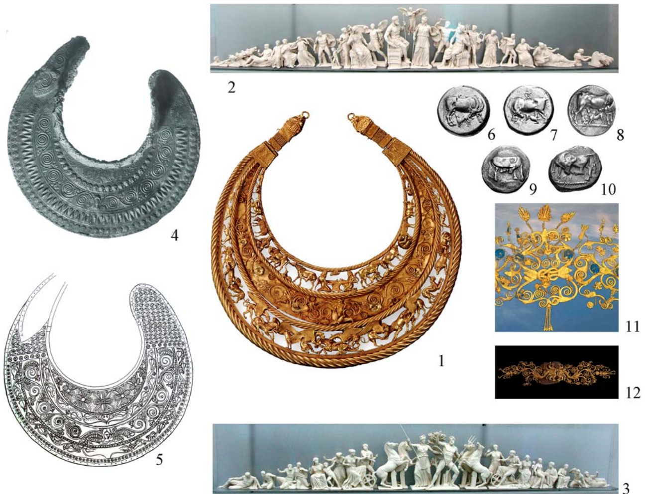
Рис. 4. Можливі запозичення в композиції, сюжетах і образах пекторалі з Товстої Могили: 1 – пектораль з Товстої Могили [Dally 2008, Abb. 2]; 2, 3 – скульптурні групи фронтонів Парфенона (реконструкція) [ http://ermakvagus.com/Europe/Greece/Athens/parthenon-rus.html ]; 4 – пектораль з Мезека [Венедиков, Герасимов 1973, ил. 230]; 5 – пектораль з Вирбиці [Archibald 1985, fig. 2]; 6-10 – монети із зображенням сцен годування теляти коровою ( 6 – Діррахія; 7 – Аполлонія; 8 – Карістос) і корови з піднятою задньою ногою ( 9, 10 – Еретрія) [Бабенко 2017, рис. 3, 4, 5, 8-10]; 11 – діадема з Вергіни, фрагмент [Andronicos 1984, р. 196]; 12 – діадема з Ставруполіса [ https://www.amth.gr/en/exhibitions/permanent-exhibitions/gold-macedon ]