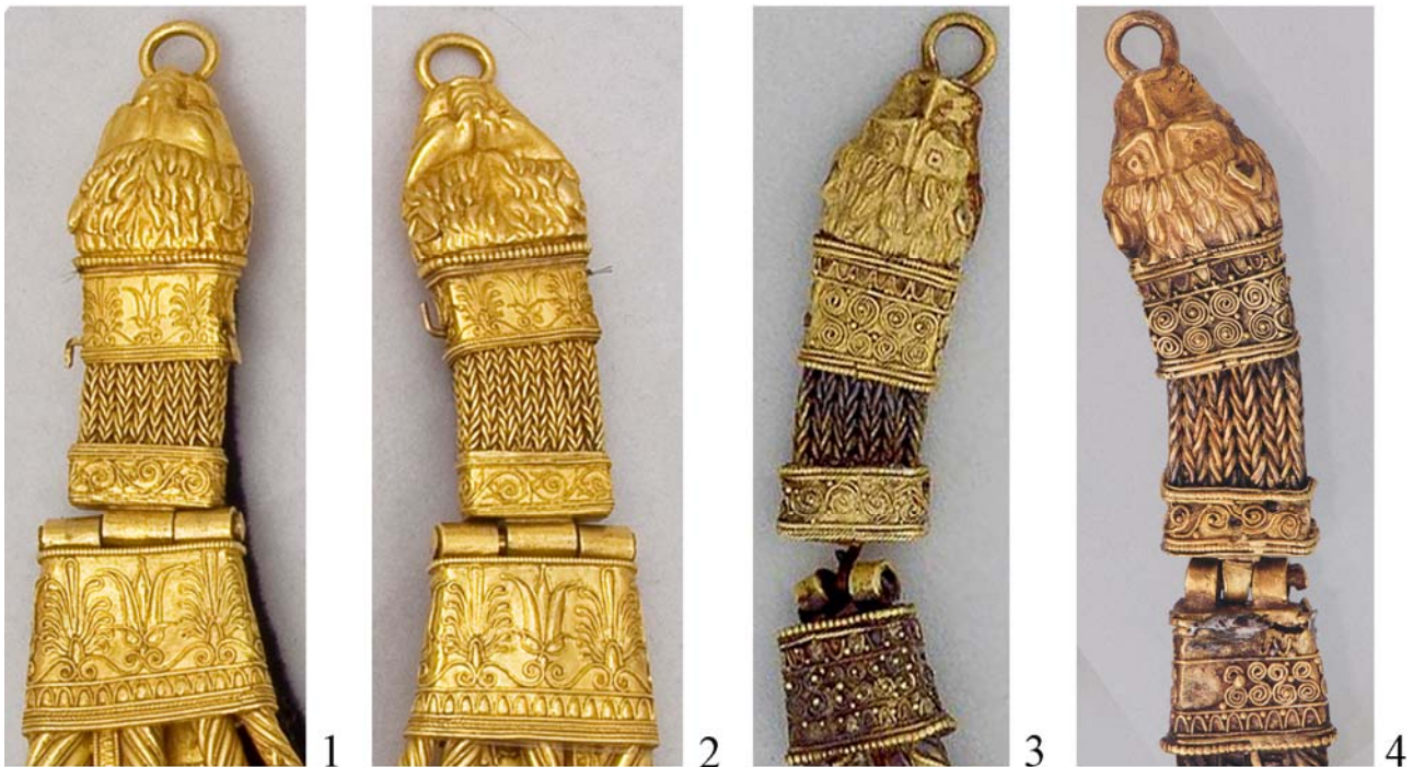
Рис. 2. Застібки пекторалей на шарнірному з'єднанні:

Порівняння шарнірних з'єднань обох пекторалей найбільш виразно демонструє різний рівень майстерності двох торевтів. Простота конструкції шарнірних петель, що складаються з трьох циліндричних трубочок, припаяних до обойм основного корпусу і застібок та з'єднаних стрижнем з розклепаними кінцями, не вимагала не тільки великого художнього хисту, а й якоїсь більш-менш значної вправності ремісника. Подібна задача була під силу навіть ювеліру-початківцю. Тим більше показова недбалість, з якою виконані ці деталі на пекторалі з Великої Близниці, навіть беручи до уваги прижиттєві пошкодження прикраси. Загальна довжина петель краще збереженого шарніру лівого боку (для носія) менша ширини зовнішнього краю обойми. Циліндри петель різного розміру і конфігурації та погано підігнані одне до одного, внаслідок чого в місці шарнірного з'єднання утворені добре помітні шпарини (рис. 2: 3, 4).