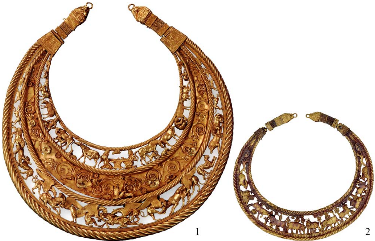
Рис. 1. Дві пекторалі: 1 – Товста Могила [Dally 2008, Abb. 2]; 2 – Велика Близниця [Piotrovsky and etc. 1986, pl. 255]