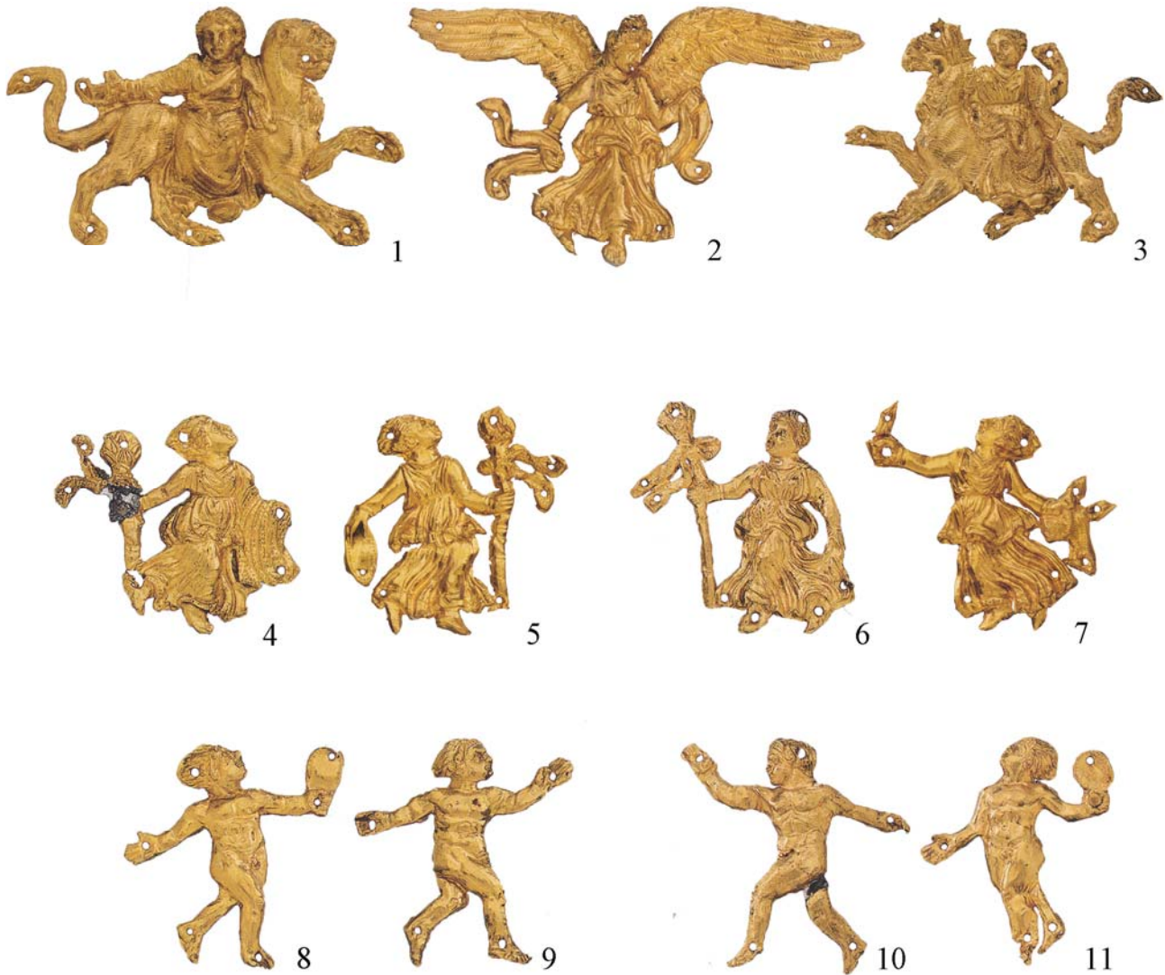
Рис. 12. Бляшки – прикраси головного убору зі склепу № 4 Великої Близниці (1-11) [Калашник 2014, с. 180, 181]