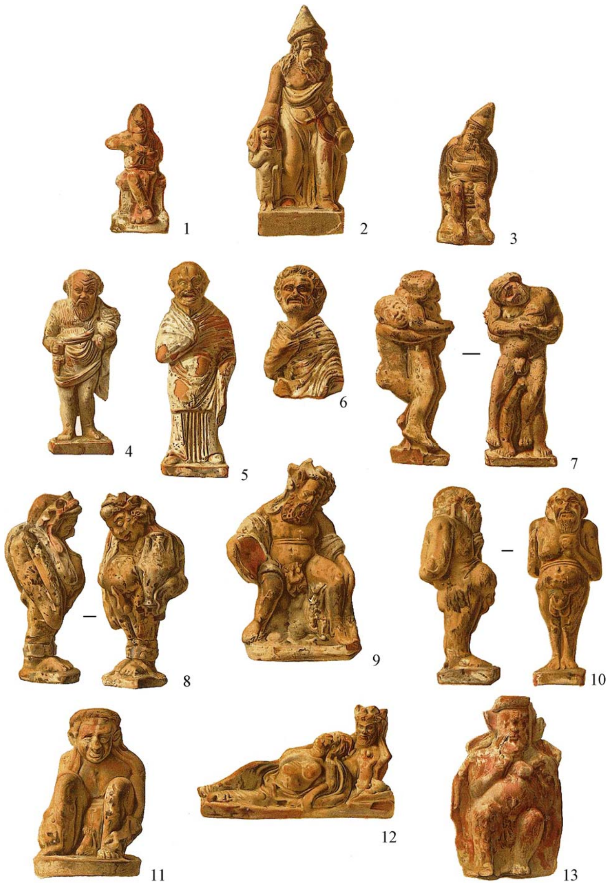
Рис. 10. Теракотові статуєтки зі склепу № 4 Великої Близниці (1-13) [ОАК за 1869 год, 1871, табл. II] Fig. 10. Terracotta figurines from tomb № 4 the Velyka Blyznytsia