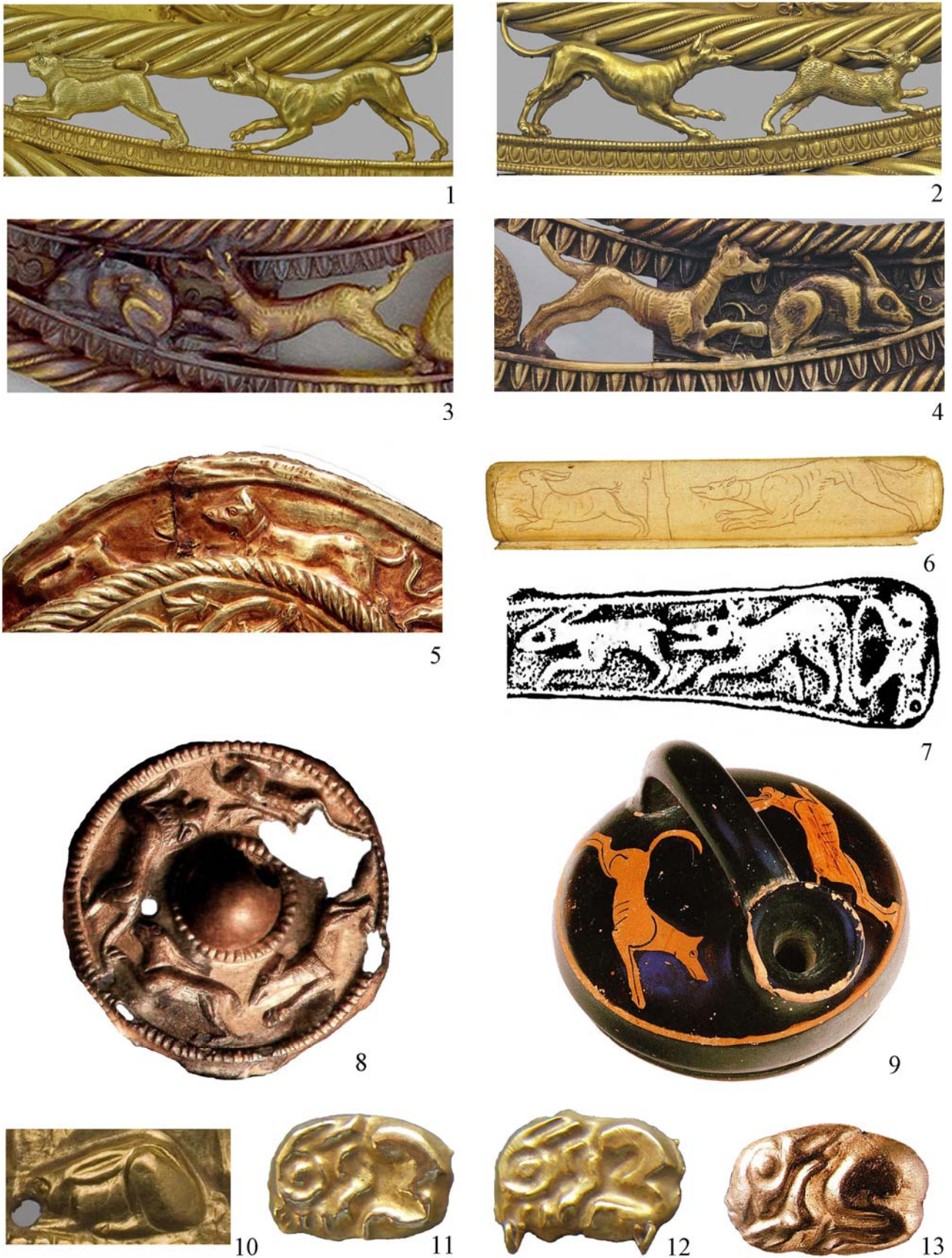
Рис. 5. Сцени переслідування зайця собакою (1-9): 1, 2 – пектораль з Товстої Могили, фрагмент [Dally 2008, Abb. 2]; 3, 4 – пектораль з Великої Близниці, фрагмент [Калашник 2014, с. 188, 193]; 5 – оббивка горита з Мелітопольського кургану, фрагмент [Scythian gold 1999, p. 226, cat. 172]; 6 – накладка кістяного гребеню з Куль-Оби, фрагмент [Piotrovsky and etc. 1986, pl. 255]; 7 – бляха з Салонта, фрагмент