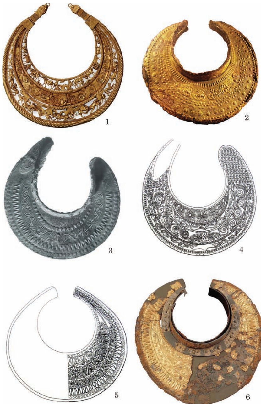
Рис. 5. Пектораль з Товстої Могили та нагрудники з Фракії та Македонії: 1 — Товста Могила; 2 — Вергіна; 3 — Мезек; 4 — Вирбиця; 5 — Катеріні; 6 — Підна (за: 1 — Dally 2008; 2 — Andronicos 1984; 3 — Венедиков, Герасимов 1973; 4 — Archibald 1985; 5 — Archibald 1985; 6 — Grammenos 2004)

була А. П. Манцевич, яка обґрунтувала свою позицію в низці статей (Манцевич 1976, 1980). Дослідниця була впевнена в північно-балканському походженні пекторалі, підтвердження якому знаходила в безлічі «фракійських» рис — від ідентичності форми з пектораліями з Мезека та Вирбиці до констатації портретної схожості персонажів центральної сцени з правителем Одриського царства Севтом III (Манцевич 1980, с. 119). Багато положень, висунутих А. П. Манцевич, були піддані критиці Б. М. Мозолевським. Дослідник заперечував фракійське походження пекторалі (на користь північнопричорноморському), а також