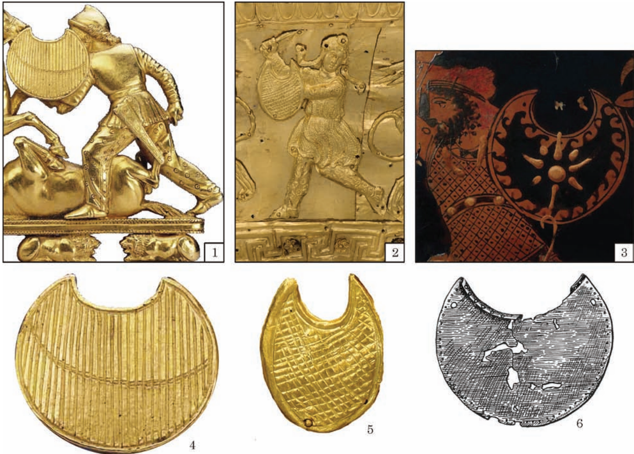
Рис. 6. Зображення щитів-пелт: 1, 4 — гребінь з кургану Солоха, фрагмент; 2, 5 — калаф з кургану Велика Близниця, фрагмент; 3 — великий лекіф Ксенофанта, фрагмент; 6 — «пластина-пектораль» з кургану 493 біля с. Іллінци (за: 1, 4 — Алексеев 2012; 2, 5 — Калашник 2014; 3 — Виноградов 2007; 6 — Галанина 1977)

терпретації досить гармонійно вписуються в побудову багатьох семантичних тлумачень сюжетів пекторалі, а також її можливої функції як статусного і церемоніального предмета. Однак запропоновані атрибуції персонажів не зовсім узгоджені з їх іконографією, нехай і гранично схематичною. Так, «герой» сцени має довгий звивистий хвіст, можливо на кінці закручений у кільце. А абрис його опонента, швидше за все, не змієподібний (рис. 7: 14; Вертієнко 2015, мал. 15), а нагадує радше розгорнутого в профіль вправо котячого хижака, що припав на передні лапи, з круглою головою, вигнутою спиною і піднятим вгору хвостом (рис. 7: 15). Тому чіткіше розуміння зображених на горитах сцен можна отримати, звернувшись до наявних сюжетів боротьби котячого хижака і персонажа зі змієподібним, загнутим в кільце хвостом. Подібними сценами прикрашені дві серії з чотирьох бронзових навершів з Краснокутського кургану та Тилігульського лиману (з Одеського археологічного музею) та випадкові знахідки близьких їм навершів з Водославки і Гардовецького лісу (Мелюкова 1981, рис. 9: 1—3; 11; Охотников, Островерхов 1989, рис. 4: 4; Полин 2016, с. 284, рис. 4: 3—10; Полин, Алексеев 2018, рис. 243: 3—10), золоті аплікації з Великої Близниці (Мелюкова 1981, рис. 12: 1)