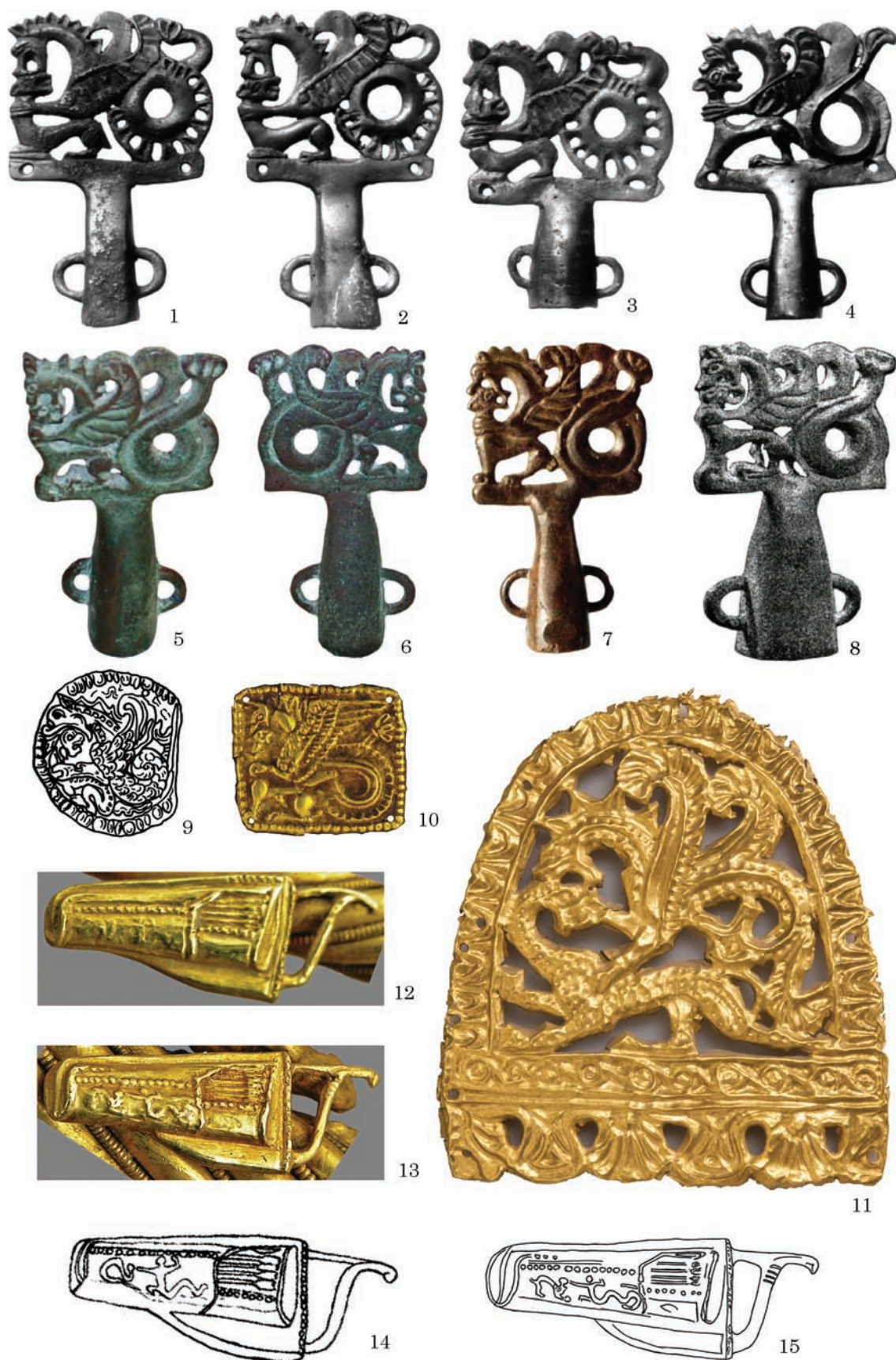
Рис. 7. Анімалістичні версії зображення Ахілла, бронзові навершя: 1—4 — Краснокутський; 5, 6 — Тилігульський лиман; 7 — Водославка; 8 — Гардовецький ліс; золоті аплікації: 9 — курган Велика Близниця; 10 — «Нікопольські кургани»; 11 — Олександропільський курган; горити на пекторалі з Товстої Могили: 12, 13 — пектораль, фрагмент; 14, 15 — прорисовки горитів (за: 1—8 — Полин, Алексеев 2018; 9 — Мелюкова 1981; 10 — Величко, Полідович 2018; 11 — Полин, Алексеев 2018; 12, 13 — ред. Полідович 2021; 14, 15 — Вергієнко 2015; Бабенко 2019)