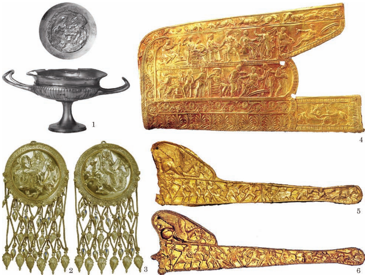
Рис. 3. Предмети торевтики із зображенням сцен з життя Ахілла: 1 — Чмирева Могила; 2, 3 — Велика Близниця; 4 — Мелітопольський курган; 5 — Чортомлик; 6 — курган 8 групи П'ять братів Єлизаветівського могильника (за: 1 — Трейстер 2009; 2, 3 — Калашник 2014; 4 — Тереножкин, Мозоловський 1988; 5 — Алексеев 2012); 6 — ed. Schiltz 2001)

ден 1995, с. 177; Алексеев 2012, с. 214, 215; Акімова, с. 607, 608), золоті накладки піхов меча з Чортомлика, кургану Чаян (Метрополітен-музей у Нью-Йорку) та П'ятибратного кургану (рис. 3: 5, 6). Але навіть серед цих «сцен зі зброєю», популярних у торевтів та споживачів їх продукції, пасаж з «Іліади», присвячений виготовленню Гефестом щита Ахілла, виділяється одним нюансом. Протягом понад 130 рядків поеми викладено детальний опис процесу саме виготовлення щита Гефестом, в якому олімпійський бог постає не просто ремісником, а по суті торевтом, зайнятим створенням неперевершеного за майстерністю художнього виробу з металу (П., XVIII, 478—609). Тому вже в силу професійного інтересу вказаний пасаж з усього тексту поеми мав бути особливо близький торевтам.