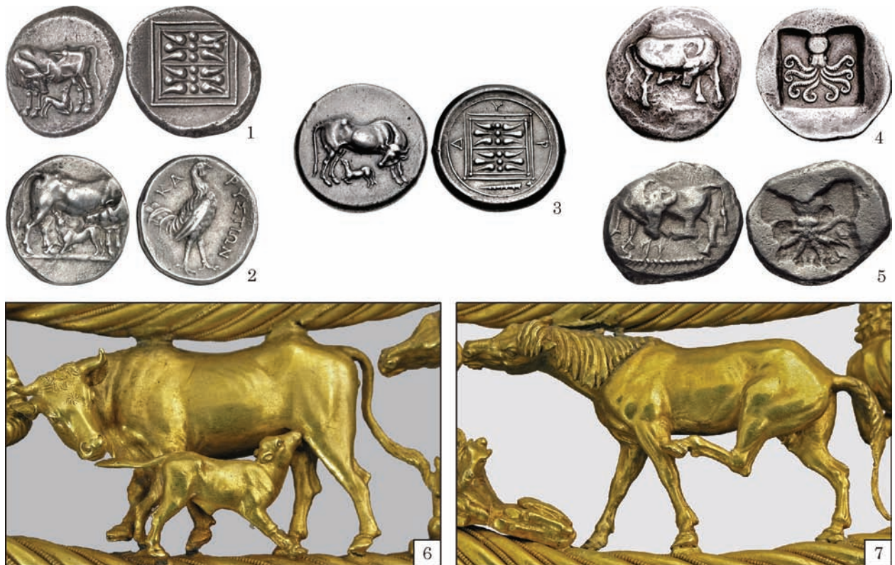
Рис. 2. Сцени «скотарського побуту»: 1—5 — монети Керкіри (1), Карістоса (2), Діррахії (3), Еритреї (4, 5); 6, 7 — пектораль з Товстої Могили, фрагменти (за: 1—5 — CNG-Ancient Greek ... 2021; 6, 7 — ред. Полідович 2021)

основи найдавнішого індоєвропейського міфологічного світобачення». Яскравим прикладом такої близькості, на думку дослідників, є схожість структури композиції пекторалі та Ахіллового щита. В описі щита «протиставлені земля і небо, день і ніч, порядок і хаос, мирне процвітання і військове руйнування (життя і смерть), домашні тварини і нападники-хижаки», а також «близьке до композиційного рішення пекторалі розміщення сцен, що уособлювали населений світ в центральному полі щита і просторове протиставлення йому Океану» (Лелеков, Раевский 1988, с. 222, 223).