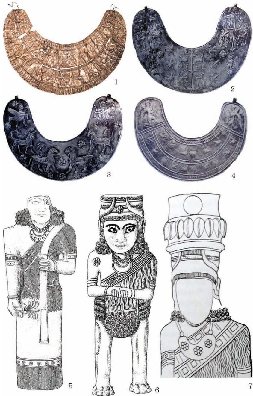
Рис. 4. Близькосхідні пекторалі: 1—4 — Урарту; 5—7 — пекторалі на бронзових скульптурах. Топрах-Кале, Урарту (за: 1 — Helwing 2008; 2—4 — Kellner 1977; 5—7 — Merhav 1991; Kellner 1977)

Інша група пекторалей, що хронологічно та територіально межує з ареалом скіфської культури, походить з пам'яток Фракії і Македонії. Серед них виділяються два типи прикрас: а) у вигляді тонких срібних або золотих пластин у формі ром-