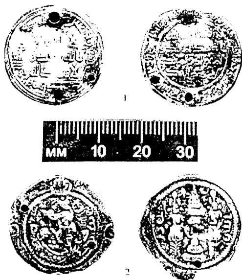
Рис. 3. Монеты из погребения № 3 катакомбы № 72

Два других захоронения рассмотрим в контексте противоположности «правый — левый». Так, слева от входа в камеру был погребен мальчик, тогда как в правой половине камеры было произведено захоронение девочки. Внутреннее деление жилища помещения у многих народов предполагало наличие женской и мужской половины. Этим, по-видимому, и объясняется расположение костяков № 1 и № 3 в катакомбе № 72. Половые характеристики погребенной № 3 подтверждает специфический погребальный инвентарь, характерный для захоронений девушек и взрослых женщин. Это и наличие двух пар одинаковых литых сережек, и ожерелья из стеклянных и сердоликовых бус, дополненного двумя монетами-подвесками, и двух бронзовых проволочных браслетов. По богатству и номенклатуре инвентаря захоронение девочки № 3 вполне сопоставимо с погребением мальчика № 2, определенного нами как «старшего» или «взрослого». Вероятно, как «старшую» («взрослую») следует рассматривать и девочку из погребения № 3. Такое определение вряд ли подходит к ребенку (погр. № 1), уложенному у противоположной от погребения № 3 стенки, хотя оба этих погребенных ориентированы головами в одну сторону — к входу в камеру. Инвентарь, обнаруженный при данном ребенке, незначителен (пара бронзовых сережек, бронзовые бубенчики